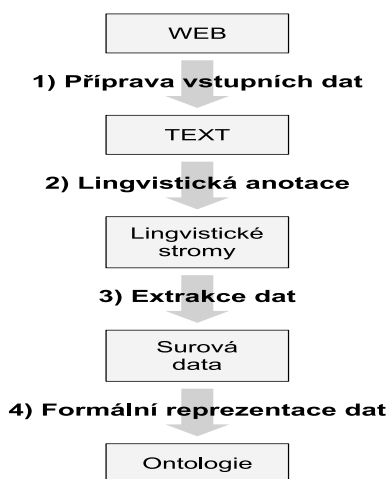
Obr. 1. Proces sémantické extrakce.

Na obrázku 1 je znázorněn proces extrakce sémantických informací z textově orientovaného webového zdroje. Data, která vzejdou z tohoto procesu můžeme přímo použít k sémantické anotaci zdroje.